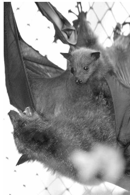
חדש בחצר האוסטרלית

את שטחם ולהרחיק פולשים וכן נוצרים הזוגות. למרות שניתן לראות הזדווגויות לאורך כל השנה, הזכרים פוריים רק בעונת הרבייה ואז מתעברות הנקבות. ההריון נמשך כחצי שנה ובתומו נולד גור אחד (תאומים הם נדירים) חסר-ישע הנצמד לאימו. האם נושאת עליה את הגור במשך השבועות הראשונים לחייו לכל אשר תלך, גם כאשר היא עפה לחפש מזון. לאחר מכן נשארים הגורים במושבות הלינה לחכות לאימותיהם שישובו מחיפושי המזון הליליים ובגיל שלוש חודשים הם כבר מפותחים מספיק בשביל לחפש מזון לעצמם. אחריותו של הזכר לצאצא