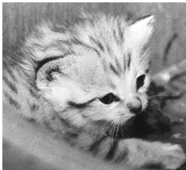
גור חתול החולות

תפוצתו, סכנה הנובעת כאמור בעיקר מהתרחבות ההתיישבות האנושית. סכנת ההכחדה הנשקפת לחתול החולות בכלל, והכחדתו מהארץ בפרט, הביאו את גן החיות התנ"כי ליזום תכנית רבייה בשבי של חתול החולות. כיום בגן החיות זוג פרטים בוגרים המהווים את הבסיס לגעין הרבייה. הזכר הגיע אלינו בהשאלה מגן החיות שבופרטאל בגרמניה ואילו הנקבה נתרמה על ידי גן החיות בלונדון. התאמתו של חתול החולות לתנאי מדבר מקשה על אחזקתו בשבי ולכן, בכדי לשפר את סיכויי הרבייה של הזוג, מוחזקים חתולי החולות שלנו מאחורי הקלעים בתנאים מיוחדים. לאחרונה הוכיחו תנאים אלו את עצמם חוג גורים ירושלמיים נולד.