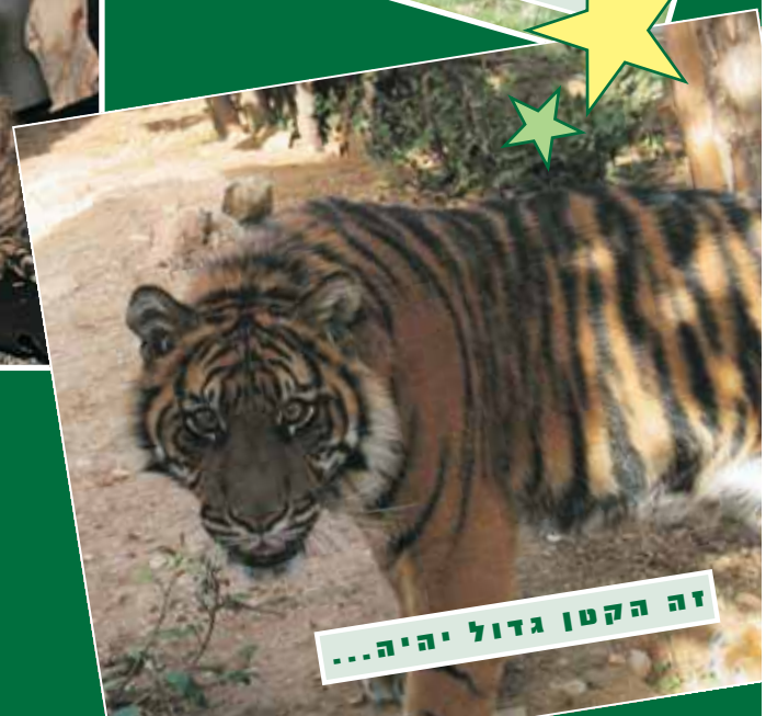
זה הקטן גדול יהיה...