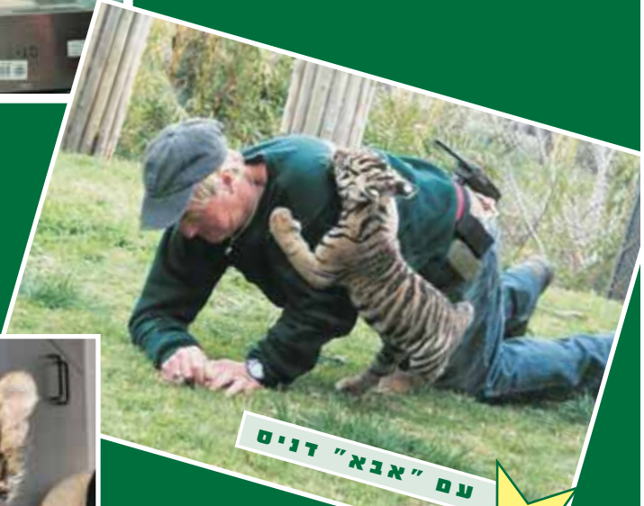
עם "אבא" דניס