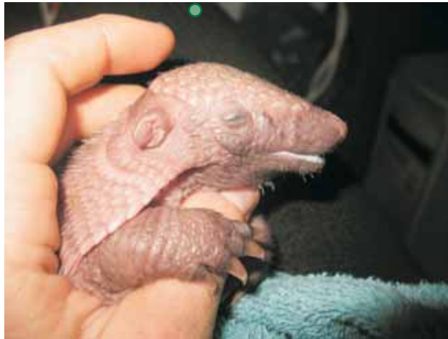
שני גורי ארמדילו הצטרפו למשפחה.

● הנמר הפרסי "מקס" הלך לעולמו בשיבה טובה. ● זוג קזוארים – עוף אוסטרלי גדול, מרשים וצבעוני, חולק חצר (מופרדת בינתיים) במתחם החצר האוסטרלית ומחליף את הוולאבים שעזבו את הגן.