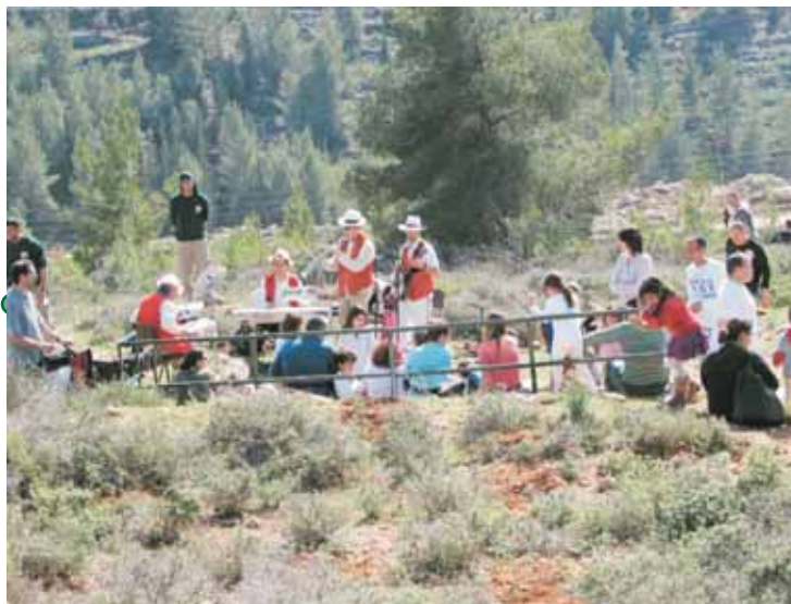
ט"ו בשבט - חגיגה של עצים ואנשים.

● המעבדה הוטרינרית ע"ש בברלי בורג נחנכת בתוך בית החולים הוטרינרי שבגן החיות, ביום השנה למותה של בברלי, שעבדה במשך שנים רבות בגן החיות. ציוד מעבדה יקר הכולל