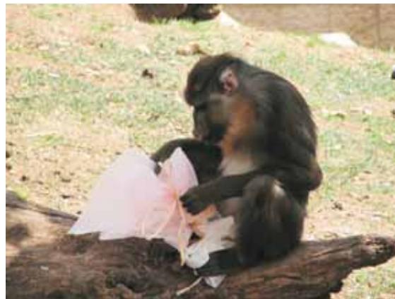
מנדריל ומשלוח מנות בפורים.

● "Zoo בגרות זו" - תכנית ראשונה מסוגה לתלמידי תיכון. כן, זו לא טעות - תוכנית מיוחדת לתלמידי כיתות י"א מבתי ספר ירושלמים מאפשרת להם לבצע עבודות חקר בתחומי העשייה השונים של גן החיות, ולזכות ב-5/4 יחידות לימוד בתעודת הבגרות.