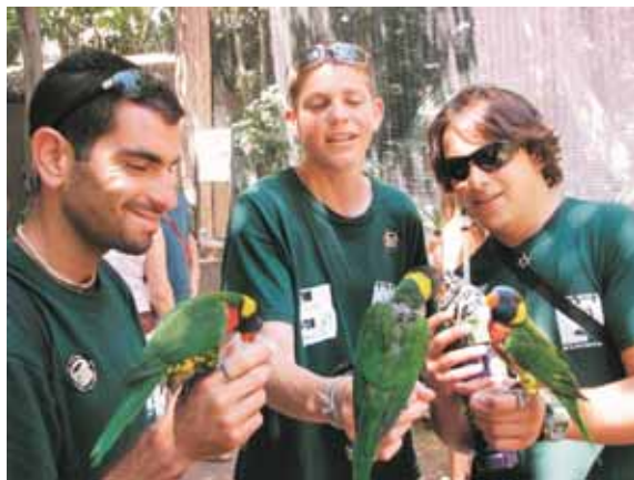
קשר בלתי אמצעי בין האדם לבעל החיים - תצוגת לורים.

גרעין הרבייה שבגן ישכון בתצוגת לוטורות א"י (להבדיל מתצוגת הלוטורה הגמדית במתחם "סיפורה של טיפה"), שתוקם באזור "גינת העקבות" במעלה העולה לכיוון המפלס העליון. האזור החדש יכיל שטח תצוגה ושטח נרחב מאחורי הקלעים. התצוגה לקהל הכרחית לצורך גיוס דעת הקהל, הסברה וחינוך, אך עיקר העבודה תיערך מאחורי הקלעים. בשטח נרחב של מאות מ"ר יוקם מרכז הרבייה, בתנאים המדמים תנאי טבע, עם התערבות מינימאלית של מטפלי הגן. אופייני של הלוטורות וצרכי