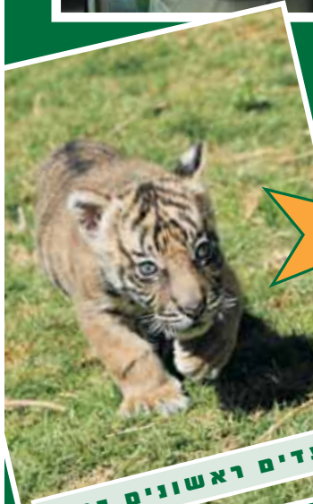
צעדים ראשונים בחוץ