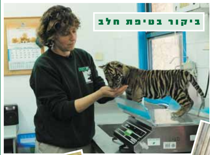
ביקור בטיפת חלב

"סילבסטר" - גור הטיגריסים שננטש ע"י אימו ונלקח לטיפול בידי אנשי צוות הגן על מנת שישרוד בחיים, עבר שנה של "תהילה" ופרסום. לפניכם מקבץ תמונות של הגור הקטנטן, שהחל את דרכו בבתי המטפלים מוקף בבקבוקים ובבובות פרווה והיום, כשהוא בן שנה וקצת, הפך להיות טיגריס גדול וחזק בעל יופי פראי ומרשים.