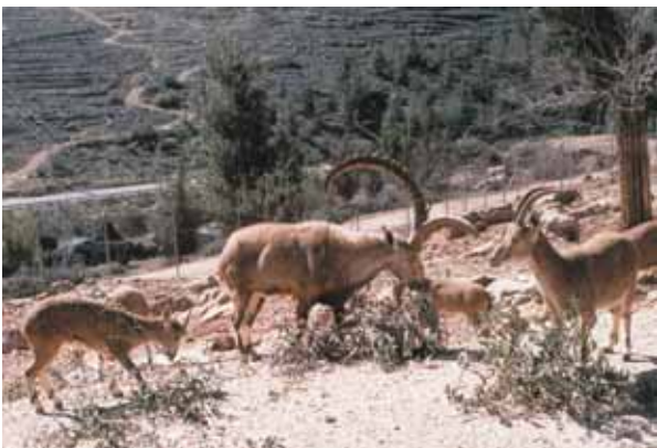
יעל נובי בארץ חיות התנ"ך.

ונחל ערוגות. אבל מצב היעלים לא תמיד היה כזה בארץ. עם קום המדינה שרד בארץ רק מספר קטן של יעלים במדבר יהודה לאחר שנים של ציד. האיסור שחל על ציד היעלים, הקמת שמורות טבע וגם צמצום מספר הטורפים הטבעיים (נמרים למשל) הביא לגידול מהיר של אוכלוסיית היעלים ולהתפשטותם לאזורים נוספים. בשנות ה-80 הועברו אף יעלים בודדים לרמת הגולן והם התרבו ויצרו אוכלוסייה של עשרות פרטים באזור ובשנות ה-90 הועברה קבוצת יעלים מישראל לממלכת ירדן בכדי לאושש את האוכלוסייה המקומית. לפי מצב היעלים בארץ, עשוי להידמות שזהו מין נפוץ, אבל, למעשה, היעל הנובי הוא מין הנמצא בסכנת הכחדה. פרט לישראל, בשאר ארצות מוצאו נמצא היעל בסכנה. הגורמים המסכנים אותו הם בעיקר הרס בית גידולו, ציד ותחרות עם חיות מבויתות כגון עיזים וחמורים. מאמצי הגנה על המין בחלק מהמדינות לא צולחים ולכן חשיבותה של האוכלוסייה הישראלית של המין היא גדולה להבטחת קיומו. מזה אלפי שנים מכירים בני האדם את היעלים, כפי שניכר מציורי סלע שנמצאו באזורנו ומאזכורי היעל בתנ"ך (תמיד בהקשר של הרים). אחרי היסטוריה משותפת ארוכה שכזו יהיה חבל לאבד מין אצילי ומיוחד כל-כך ואיתו את הגדיים המקסימים.