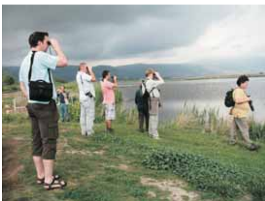
חברי הכנס באגמון חולה.

מדבר יהודה, שמורת גמלא ואגם החולה וכמובן גם סיור בעיר העתיקה בירושלים. היתה זו גם הזדמנות להיפגש פנים אל פנים עם עמיתים לעבודה, להחליף מידע מקצועי, ולבנות קשרי עבודה עתידיים. אנו מקווים ש"סנונית" ראשונה זו בישראל, שמהווה היום מוקד משיכה לציפורים, תהווה בעתיד גם מוקד משיכה לעוסקים במקצוע הצפרות.