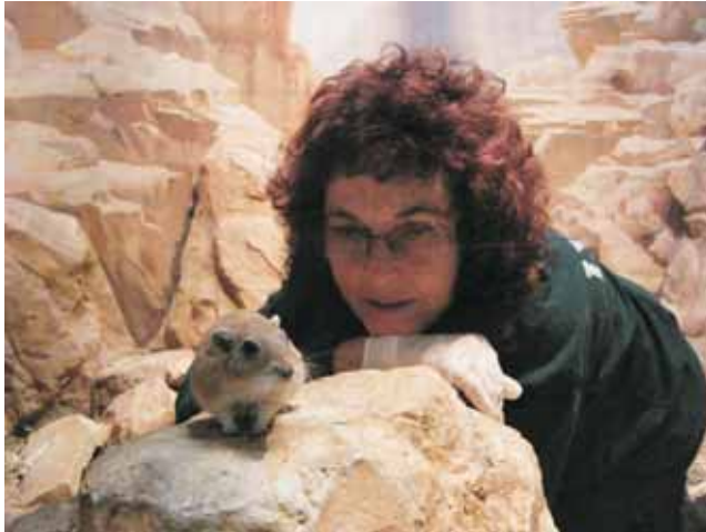
עליזה ופסמון בביתן.

קרניהם מאשתקד. הרי ידוע שבמשפחת האיילים, הקרניים נושרות מדי שנה והזכרים מצמיחים קרניים חדשות לתפארת. בסיפור אמיתי זה, נדבר דווקא על אלו שקרניהם קבועות כל השנה - וכל החיים. במקרה הראשון נספר על יעל זכר המכונה "מס' 17". "מלחמת היהודים" בין היעלים הזכרים על שליטה בליבותיהן של היעלות גרמו לו לאבד חצי קרן. הצוות הרפואי של גן החיות התלבט האם לנסות ולחבר לנ"ל משהו בסגנון קרן תותבת, אך העובדה שהוא מסתדר חברתית, עם חצי קרן בלבד וממשיך במסגרת המלחמות הורידה את התכנית השאפתנית מן הפרק. במקרה השני היתה דישונה שהגיעה למרפאת הגן עם קרן שבורה. ולא סתם