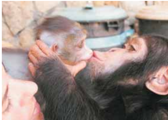
התמונה הזוכה בתחרות הצילום.

מהספארי סיפרה במושב חינוך על "ערב חלומי בגן החיות" ובאותו מושב, דיבר יהודה גת על מערכת החינוך החדשה בגן גורו. במושב טיפול ווטרינריה סיפר דניאל אבו חיר מגן החיות הלימודי חיפה על התערבות צוות הגן בקבוצת הבבונים. כחלק מרעיון החיבור בין גני החיות, התקיימה גם תערוכת צילום בנושא "יום בגן החיות". כל גן חיות הציג שלוש תמונות שתיארו את הקשר החזק בין העובדים והמבקרים ובין בעלי החיים. התמונות היפהפיות הטיבו לתאר את האהבה והמחויבות של העובדים למטרות גן החיות: טיפול הולם בבעלי החיים, חינוך, ואהבה. לאחר המושבים המקצועיים הזמנו המשתתפים