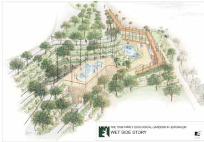
“סיפורה של טיפה” - תוכנית הבנייה.

במרכז עבודות הפיתוח של גן החיות לשנת 2008 תעמוד תחילת העבודה להקמת תצוגת המים החדשה - “סיפורה של טיפה”. למבקרי גן החיות התנ”כי תהיה הזדמנות להכיר וללמוד מעט מתוך נושא המים ובתי גידול המימיים, תוך הכרת מגוון הדגים המיוחדים לבתי גידול שונים ביבשות שונות והכרת הסכנה המאיימת על אלו. התצוגה החדשה שתקום באזור המאכלס