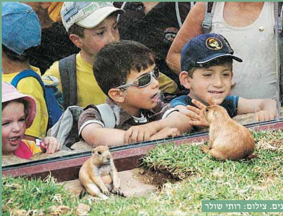
פנים אל מול פנים.