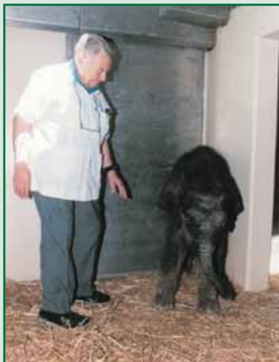
עם "צ'פטי" הפילון.

לא איש של בעלי חיים היה טדי - אולם הוא ראה בגן החיות מקום מפגש לכולם, מקום לימוד וחינוך, מקום פתוח לאוכלוסיות בעלי צרכים מיוחדים, מקום המושך מבקרים לעיר - כל אלה היו בחזונו של ראש העיר לשעבר, כאשר פעל להעביר את גן החיות ממשכנו הישן ברוממה, ולהקים גן חדש מודרני